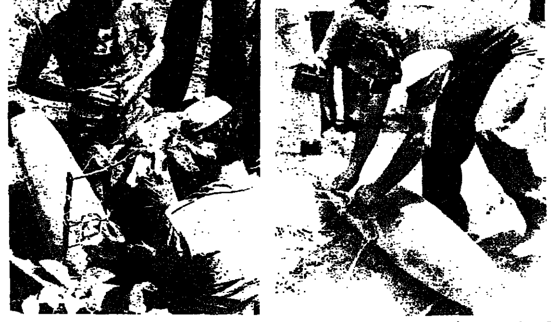
خبراء من المقاومة يماجون الصاروخ الاسرائيلي الذي لم يتفجر في «مخيم البرغلية»